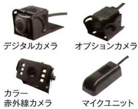
デジタルカメラ オプションカメラ カラー赤外線カメラ マイクユニット