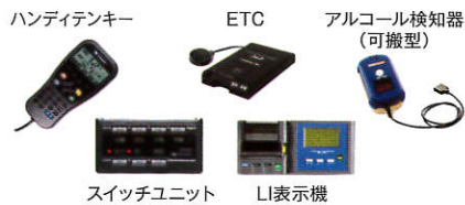
ハンディテキー ETC アルコール検知器(可搬型) スイッチユニット LI表示機