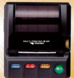
新計量法印字は マルチプリンタⅣ(別売)で行えます。

システム・タクシー用タコグラフ機能 内蔵により情報のデータ化を実現。 業務効率アップで経費を削減。