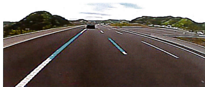
※上記画像のブルーラインは、車線認識を分かり易く表現するためのイメージであり、実際の機能ではありません。

『車線逸脱』や『ふらつき走行』が記録された運行カードを読み取ると、警告メッセージを画面に表示、危険運転を見逃しません。